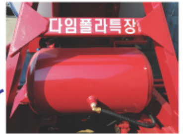
에어 탱크/ Air tank 고용량(130L) 알루미늄 재질