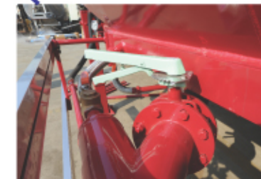
버터플라이 밸브/ Buterfly Valve