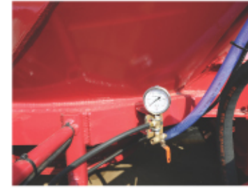
압력계/ Pressure gauge 에어백 측정용